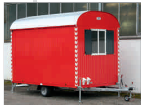
Abbildung zeigt optionale Sonderlackierung

Ausstattung: 1 Tür · 1 Kst.-Schiebefenster mit ESG-Sicherheitsverglasung · 1 Windfang · 2 Truhenbänke 1,80 m · 1 Tischplatte 1,80 m · 6 Kleiderhaken · Elektroinstallation mit Deckenlampe, Schalter und Heizlüfter 2 kw