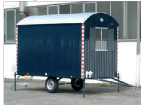
Abbildung zeigt optionale Sonderlackierung

Ausstattung: 1 Tür · 1 Kst.-Schiebefenster mit ESG-Sicherheitsverglasung · 1 Windfang · 2 Truhenbänke 1,80 m · 1 Tischplatte 1,80 m · 6 Kleiderhaken · Elektroinstallation mit Deckenlampe, Schalter und Heizlüfter 2 kw