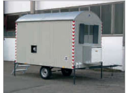
Abbildung zeigt optionalen Propan-Außenwandheizer mit Gasflaschenkasten 2 x 11 kg

Ausstattung: 1 Tür · 1 Kst.-Schiebefenster mit ESG-Sicherheitsverglasung · 1 Windfang · 2 Truhenbänke 1,80 m · 1 Tischplatte 1,80 m · 6 Kleiderhaken · Elektroinstallation mit Deckenlampe, Schalter und Heizlüfter 2 kw